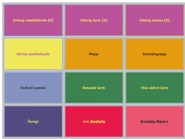
Bilden visar exempel på menyer i statuspanelen